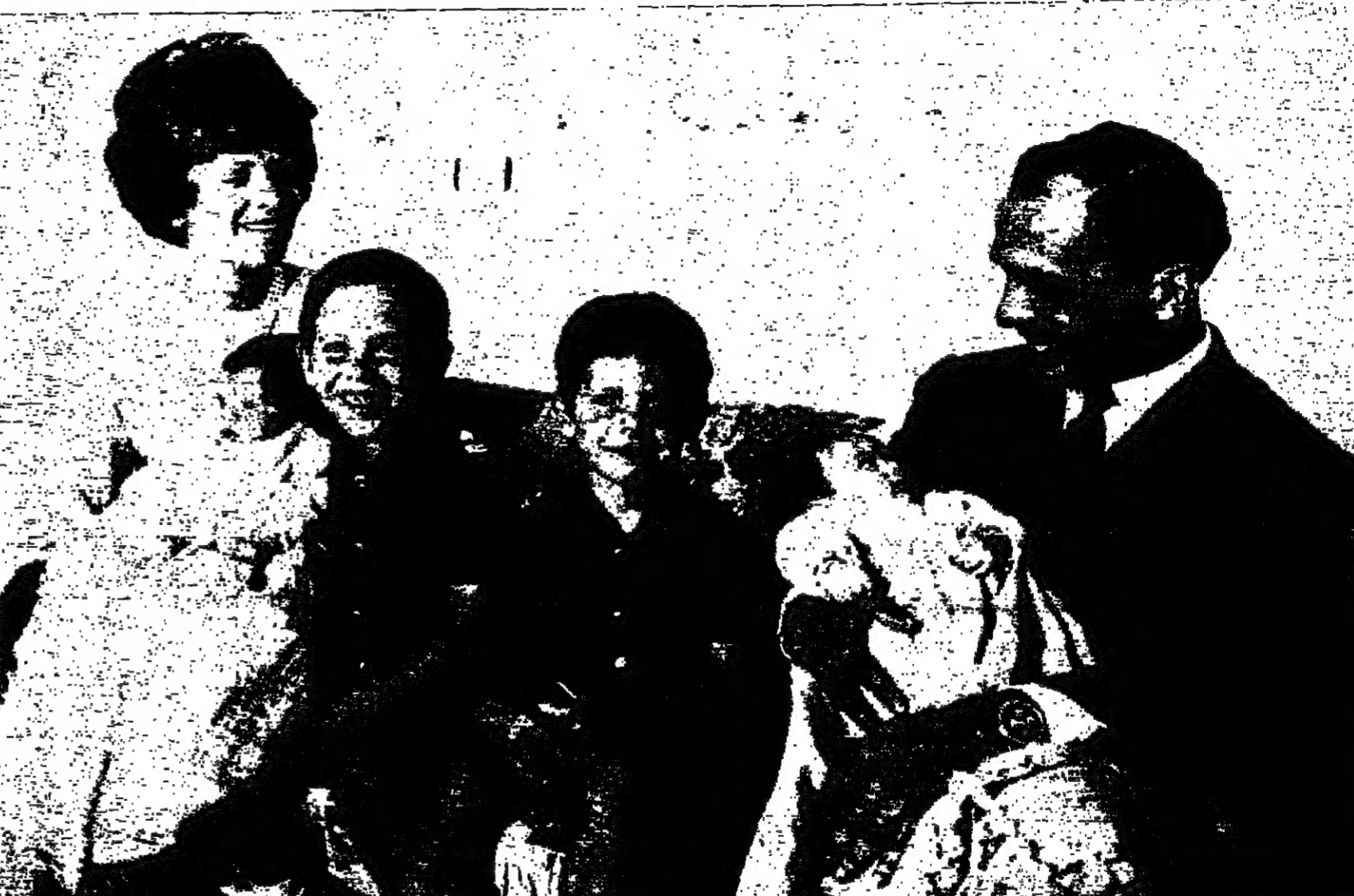
اول صورة تنشر لحالة الملك وسوا الامرة من العظمة وهما يحتضاناً بحنو وحضن صاحبي السمو الاميرين زين وعاشقة بيما توسط الجميع صاحب السمو الاميران عبداللّه وفصل . امد الله في عمر جلالة الحسين وابقاه ابا عطوف الاسرة الهاشمية وستره الاردنية التي تكن له الصب والوفاء وتسير وراء قيادته الحكيمه نحو النصر الاكيد

واشنطن - رويتر - اعلن الرئيس جونسون ان الولايات المتحدة والاتحاد السوفياتي اتفقا على بدء مباحثات في اقرب وقت لتحديد وتخفيض أنظمة الاسلحة القوية الدفاعية والهجومية . ان تكون سهلة واعان الرئيس جونسون ذلك عندما اجتمع ممثلو اكثر من خمسين دولة في البيت الابيض لوضع مباحثات حفر انتشار الاسلحة القوية . وحذر الرئيس جونسون من ان مباحثات حول تحديد وتخفيض شبكات الصواريخ الموجهة العابرة للقارات والقاذف القاذبة لهذه الصواريخ ان البيعة على الصفحة الخامسة عمود ٤